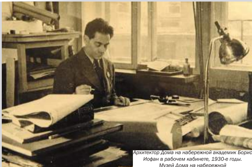
Архитектор Дома на набережной академик Борис Иофан в рабочем кабинете, 1930-е годы.