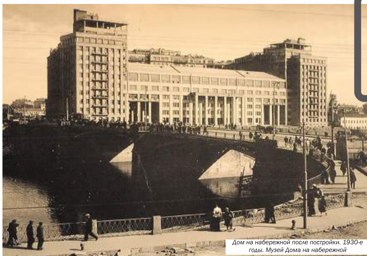
Дом на набережной после постройки. 1930-е годы. Музей Дома на набережной

Но разговор о жильцах, друзьях и соседях - это отдельный разговор. Дело это тонкое и требует особого подхода. «Простых» жителей здесь никогда не было. Теперь о легендах! Их настолько много, поэтому только о главных.