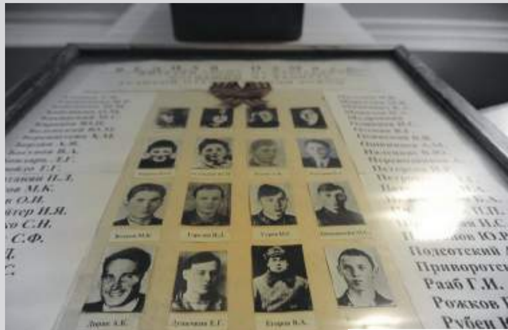
Музей Дома на набережной