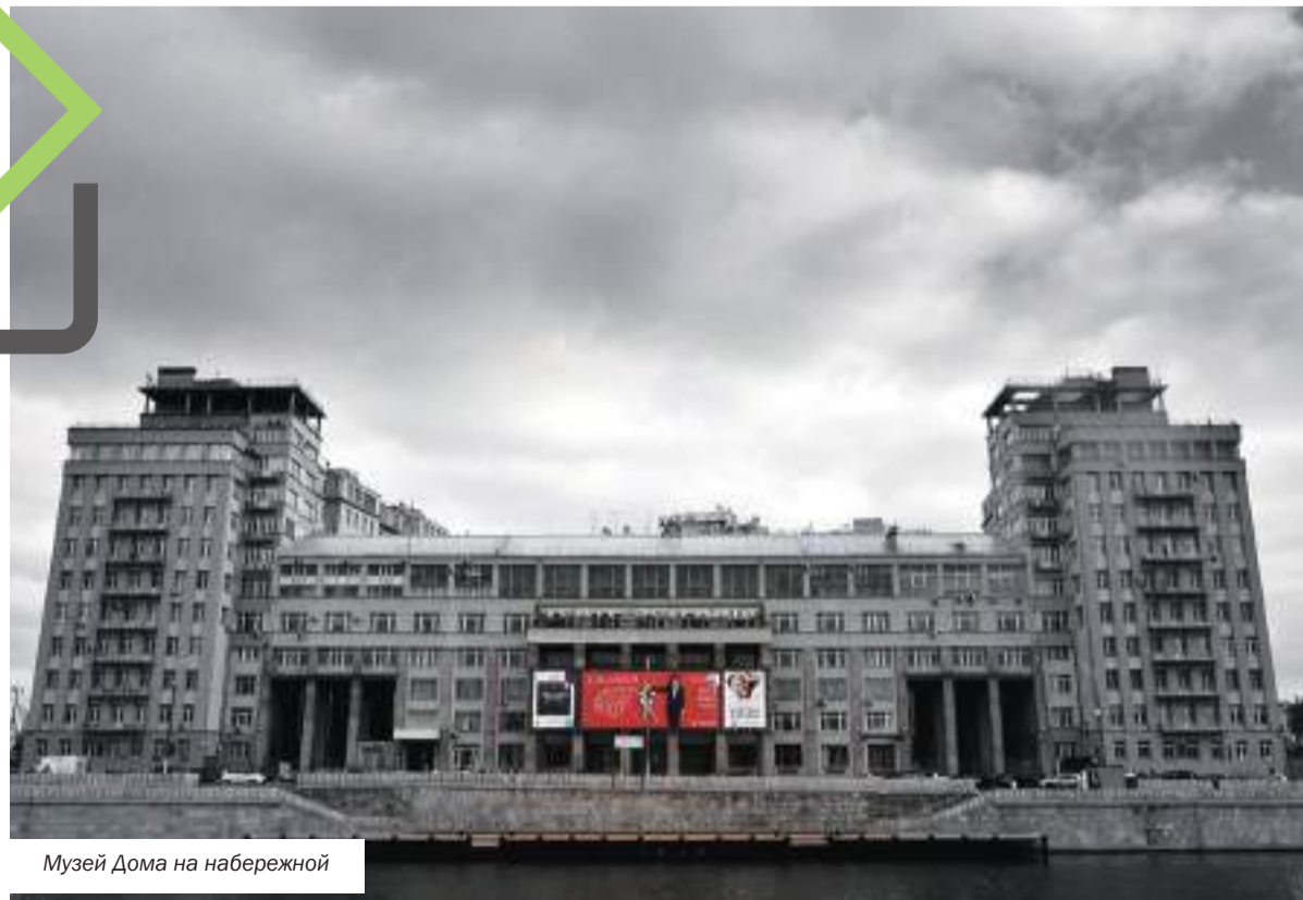
Музей Дома на набережной

По материалам журналиста-международника Олега Иткина