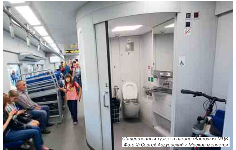
Общественный туалет в вагоне «Ласточки» МЦК.