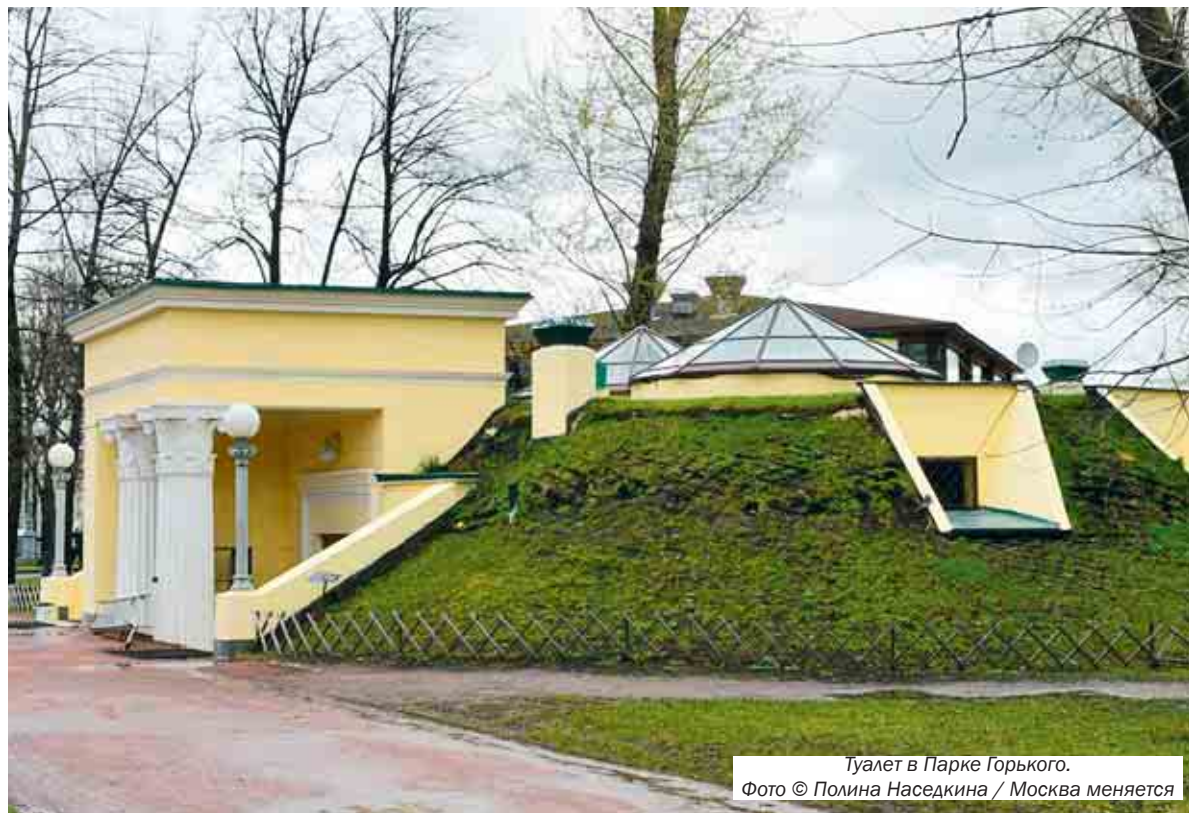
Туалет в Парке Горького.

Описываемый эпизод имел место в 1910 году. Не так уж и давно, если мерить мерками истории.