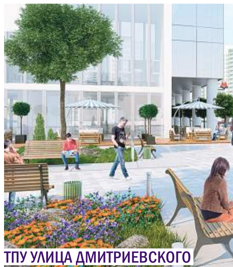
ТПУ УЛИЦА ДМИТРИЕВСКОГО