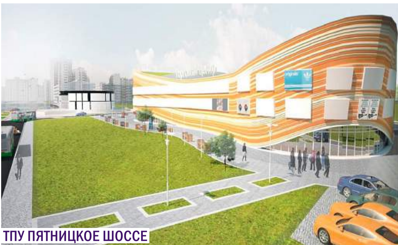
ТПУ ПЯТНИЦКОЕ ШОССЕ

Возведение транспортно-пересадочных узлов (ТПУ) на новых станциях метро позволит создать более 257 тыс. рабочих мест. Об этом сообщил заместитель мэра Москвы по градостроительной политике и строительству Марат Хуснуллин.