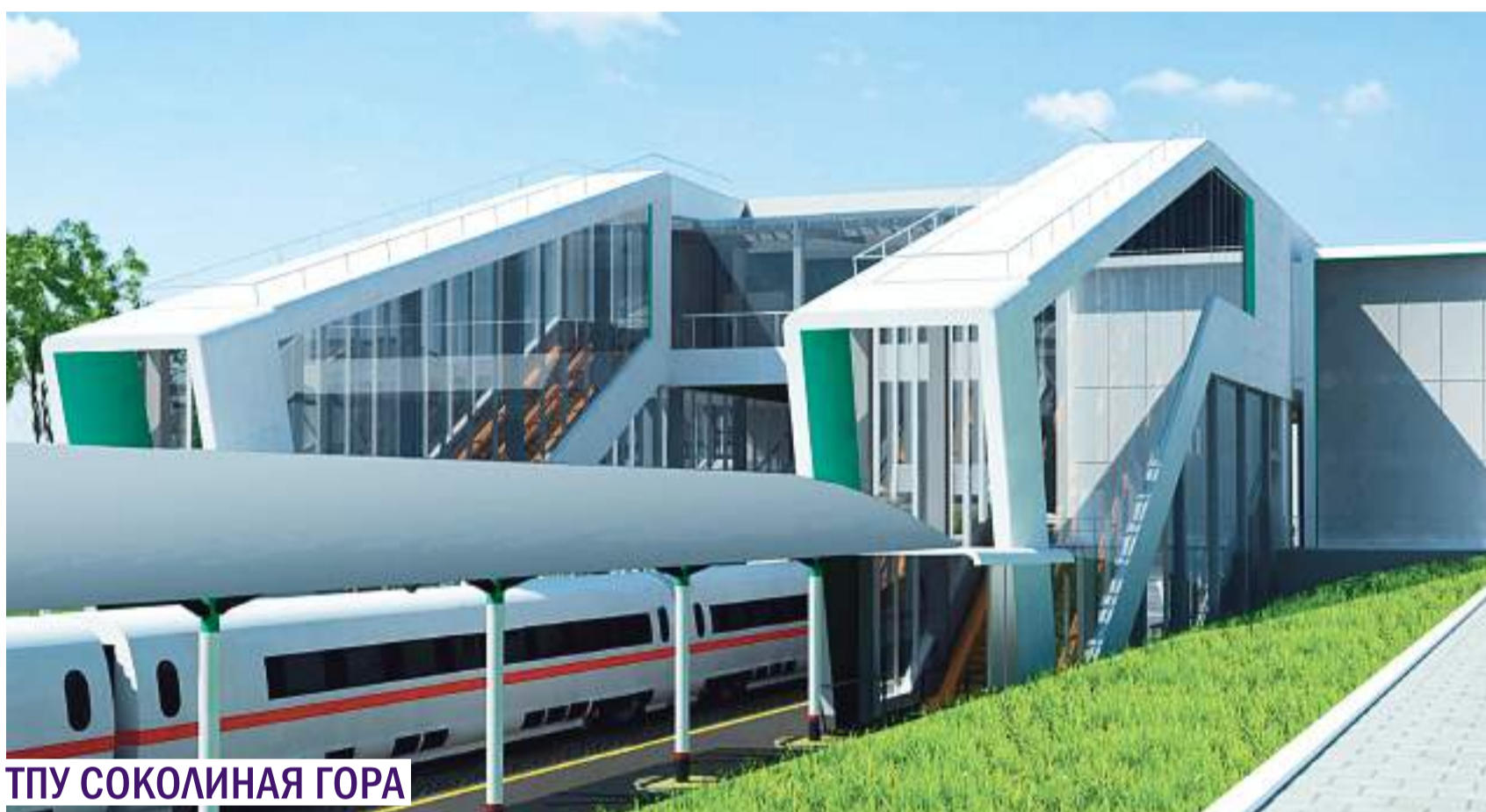
ТПУ СОКОЛИНАЯ ГОРА